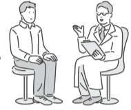
表 胃・肺がん検診