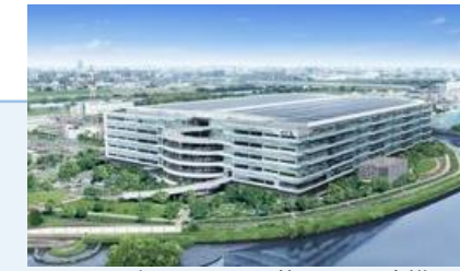
まちづくり、民間施設との連携