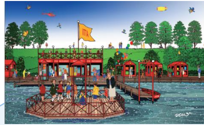
魅力あるコンテンツの展開