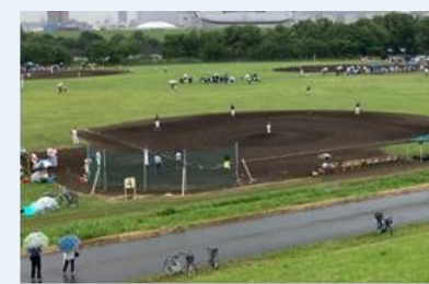
上流野球場側のにぎわい促進