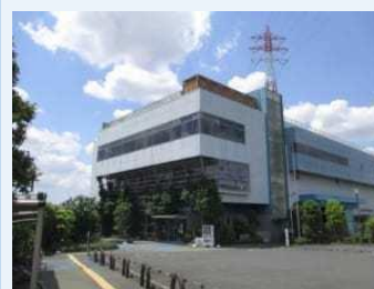
拠点となるリサイクルプラザ