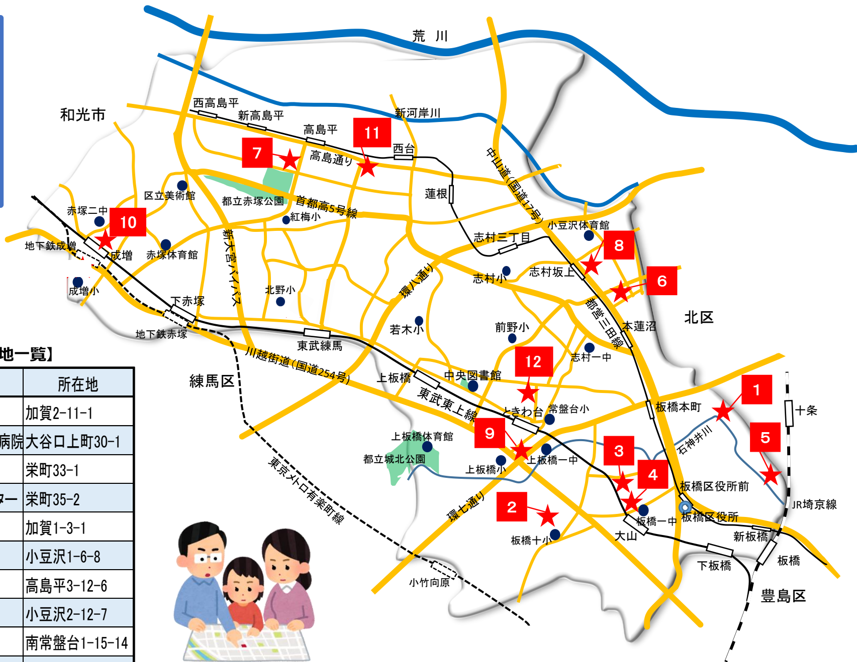
【板橋区緊急医療救護所 所在地一覧】