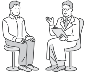
表2 医師によるもの忘れ相談

▶ とき・ところなど ＝表2 参照▶ 対象 ＝区内在住で、もの忘れで医療機関にかかっていない方※家族(区外在住を含む)も相談可▶ 定員 ＝各回1人(申込順)▶ 申込・問 ＝電話で、希望会場を担当するおとしより相談センター