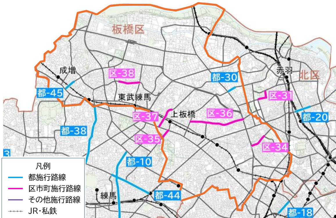
優先整備路線(区部)位置図(板橋区付近)