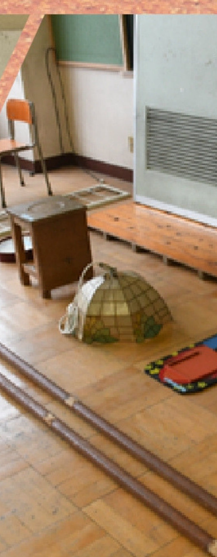
令和7年10月26日開催:校内見学会（ほぼ全教室開放）、高島平を面白がる会、アップサイクルプロジェクト、卒業生企画「高七小フォーエバー！キノコラリー！」、高七Tシャツデザイン投票を実施