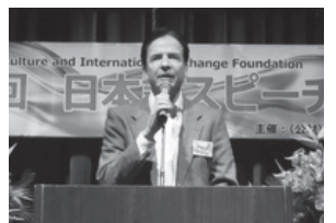
日本語学習の成果を ご覧ください

▶とき＝2月21日(土)14時～17時▶ところ＝グリーンホール2階ホール▶内容＝外国籍の方による日本・自国の文化などをテーマにしたスピーチなど▶定員＝200人(先着順)※当日、直接会場へ。▶問＝(公財)板橋区文化・国際交流財団(グリーンホール内) ☎3579-2015