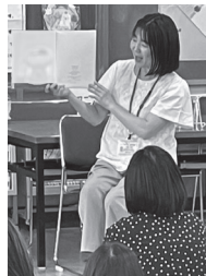
読み聞かせの様子

絵本は、おとなも子ども・赤ちゃんも関係なく、みんなで楽しむことができます。これからも絵本専門士の活動を通して、みなさんに絵本の魅力を伝えていきたいと思っています。ぜひ、一緒に絵本を楽しみましょう。