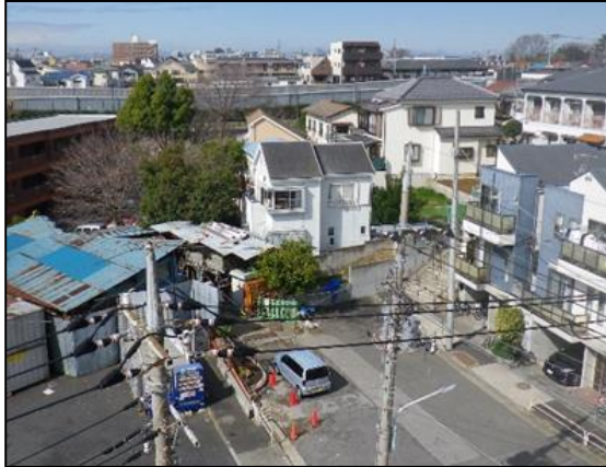
平成30年（事業認可時）