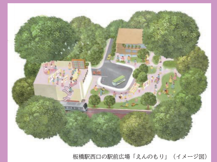
板橋駅西口の駅前広場「えんのもり」（イメージ図）