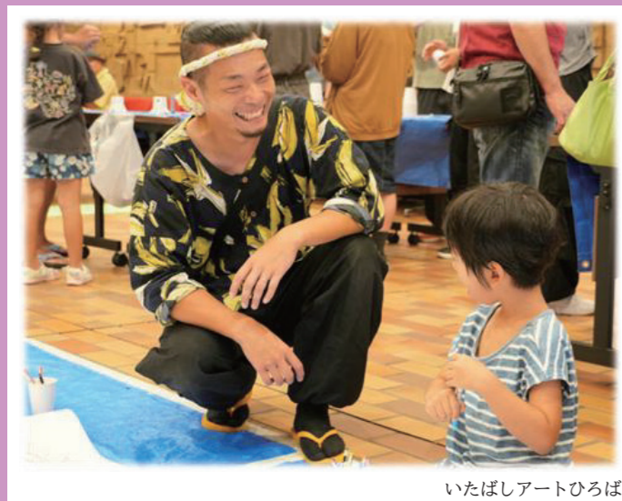
いたばしアートひろば