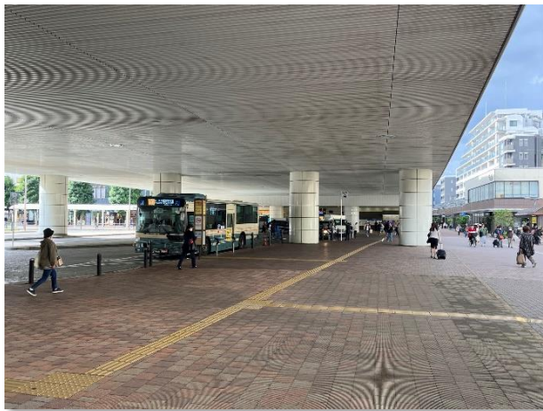
▲ 石神井公園駅高架下