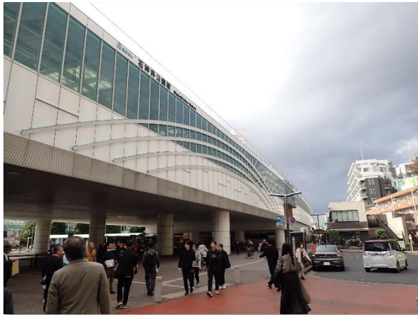
▲ 石神井公園駅（北口）