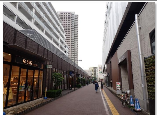
▲ 石神井公園駅周辺歩行者空間