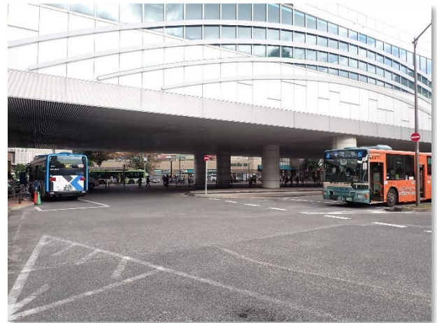
▲ 石神井公園駅（南口）