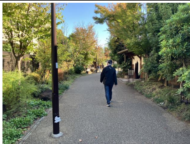
▲ 世田谷代田駅～下北沢駅間