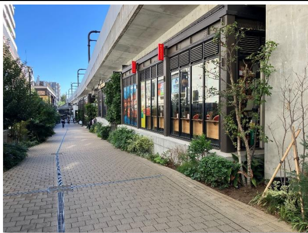
▲ 下北沢駅周辺歩行者空間