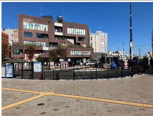
▲ 下北沢駅前広場（整備中）