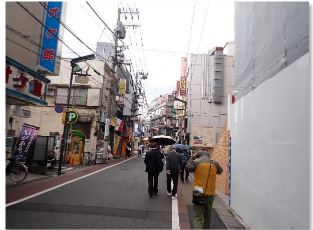
▲ パークロード石神井（商店街）