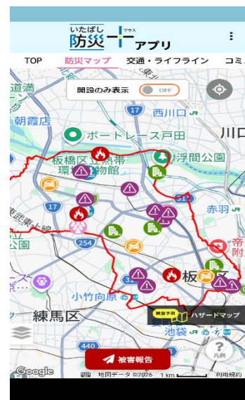
図2：いたばし防災+アプリ (被害情報マップ画面)

区民のみなさまから被害情報を収集することで、区は迅速な災害対応に活用し、多くの方に情報共有ができ、自助・共助活動の支援につながります。今後も、アプリの利用者増加だけでなく、操作方法の習熟にもつながる取組を進めていきます。