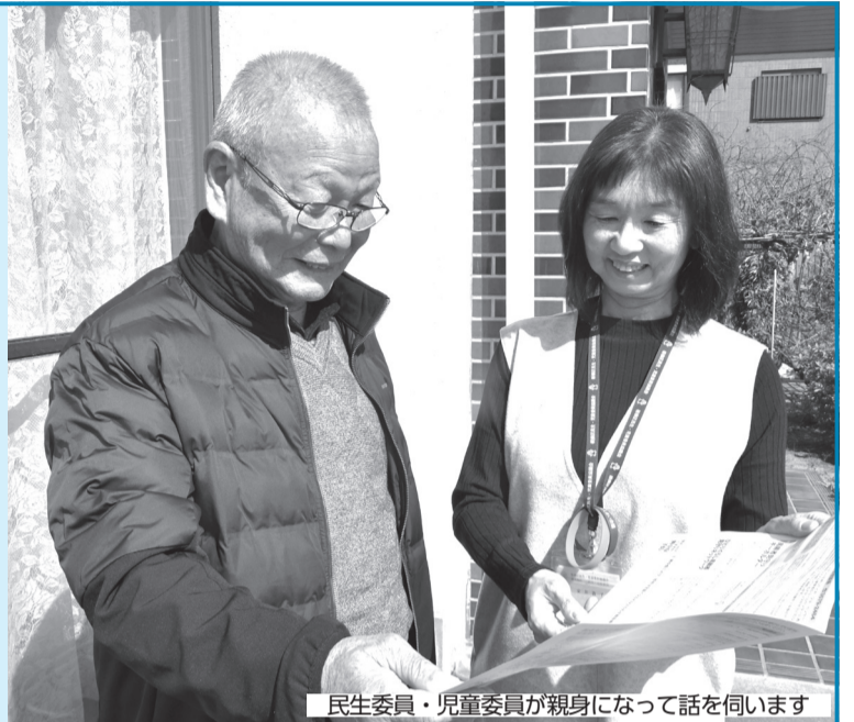
民生委員・児童委員が親身になって話を伺います