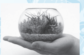
ガラスアクアリウム

▶とき= 5月30日(土)・31日(日)・6月13日(土)・14日(日)、11時~12時・13時~14時・15時~16時、各1回制 ▶内容= 石・流木・水草でガラスアクアリウム作り ▶定員= 各回16人(抽選)※小学3年生以下は保護者同伴 ▶費用= 2000円 ▶申込・問= 5月20日(水)まで、FAX・Eメールで、熱帯環境植物館 ☎ 5920-1132 nettaikan@seibu-la.co.jp