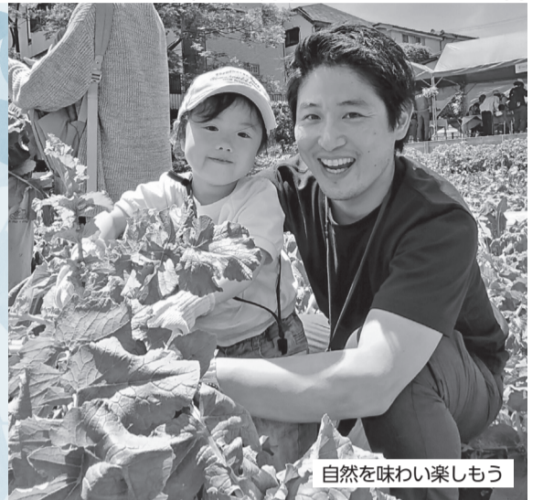
自然を味わい楽しもう