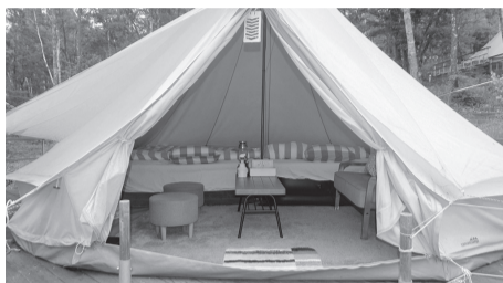
キャンピングリゾート

▶ 申込 =5月22日(必着)まで、往復はがき(1団体1枚)で八ヶ岳荘(〒399-0200長野県諏訪郡富士見町立沢字広原1-1322)※申込記入例(4面)の項目と部屋数(和室・洋室・和洋室の希望も)またはキャンピングリゾート・テントサイトの利用の旨、希望日、宿泊日数(3泊以内・第3希望まで)、利用予定人数を明記。