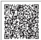
▲詳しくはこちらから

※障がいがある方は上記料金の半額・介護者は1人まで無料、4~14歳は子ども料金、3歳以下は無料。※ランタンの無料貸出あり※宿泊者は、体育館・研修施設などを無料で利用可(利用