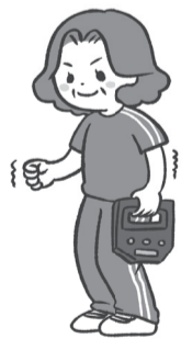
表 フレイルチェック測定会

▶ とき・ところ = 表参照 ▶ 内容 = 講義「フレイル予防」・体力測定など ▶ 対象 = 区内在住の50歳以上で、要介護認定を受けておらず、半年後に行う同測定会に参加できる方。 ※参加経験がある場合は、前回の参加から半年以上経過した方。 ▶ 定員 = 各日20人(抽選) ▶ 申込・問 = 5月22日(必着)まで、はがき・FAX・電子申請(区ホームページ参照)で、生涯活躍推進課フレイル・介護予防係 ☎3579-2293 ☎3579-4153 ※申込記入例の項目と生年月日、希望日(第3希望まで)を明記。