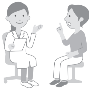
表 COPDチェックリスト

COPDは、主に長期間の喫煙が原因とされる肺の病気です。最初はせき・たん・息切れなどの症状ですが、次第に呼吸障害が進行し、死に至ることもあります。COPDでありながら未受診の方は500万人以上いると推定され、死亡者数は年間約1万8000人と報告されています。喫煙者は少しでも早く禁煙して治療することが大切です。チェックリスト(表参照)でいくつかの症状・条件に当てはまる場合は、早めに医療機関を受診しましょう。