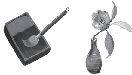
表1 かくしゃく講座

※申込記入例(6面)の項目と希望教室・施設名(徳丸ふれあい館の茶道はAまたはB)を明記