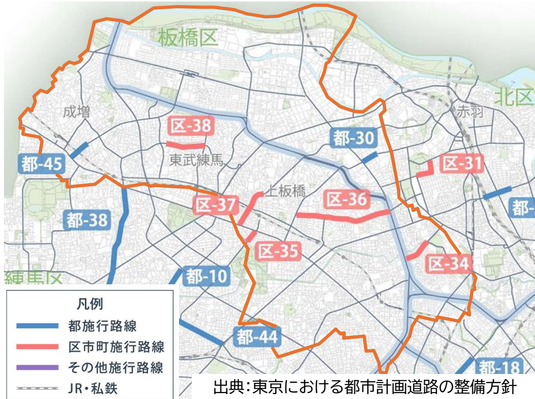
優先整備路線(区部)位置図(板橋区付近)