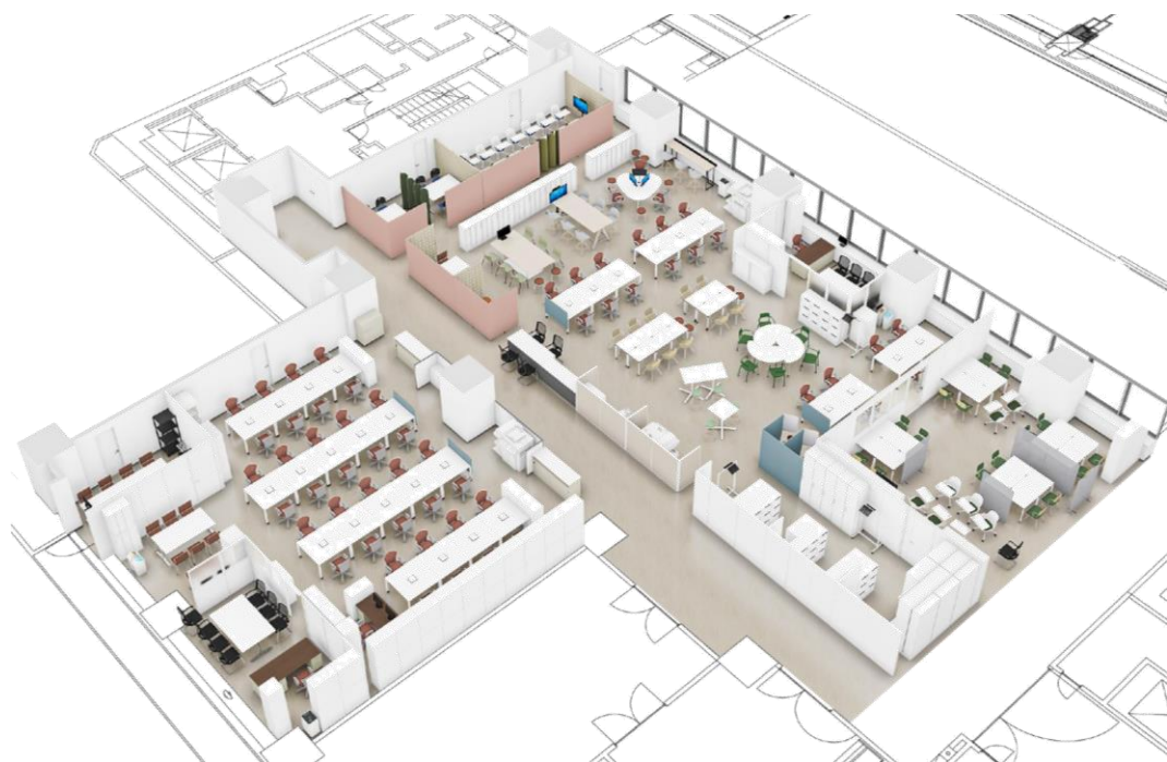
▲レイアウト変更後の執務室イメージ

※実施部署のPTIにより、レイアウト案・運用ルール等の検討を行い、新たなオフィス整備を実施した。