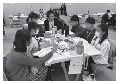
商品企画体験の様子