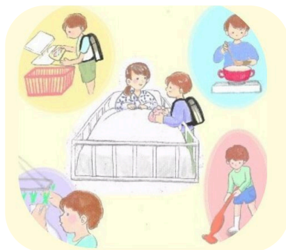
ごはんや洗濯などの おうちの家事/ 家族のことを気にかける