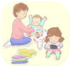
きょうだいのお世話

ヤングケアラーは、家族のお世話やサポートをしながら、 日々の生活を支えている子ども・若者のことです