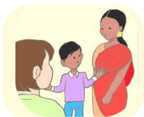
通訳や日本語のサポート