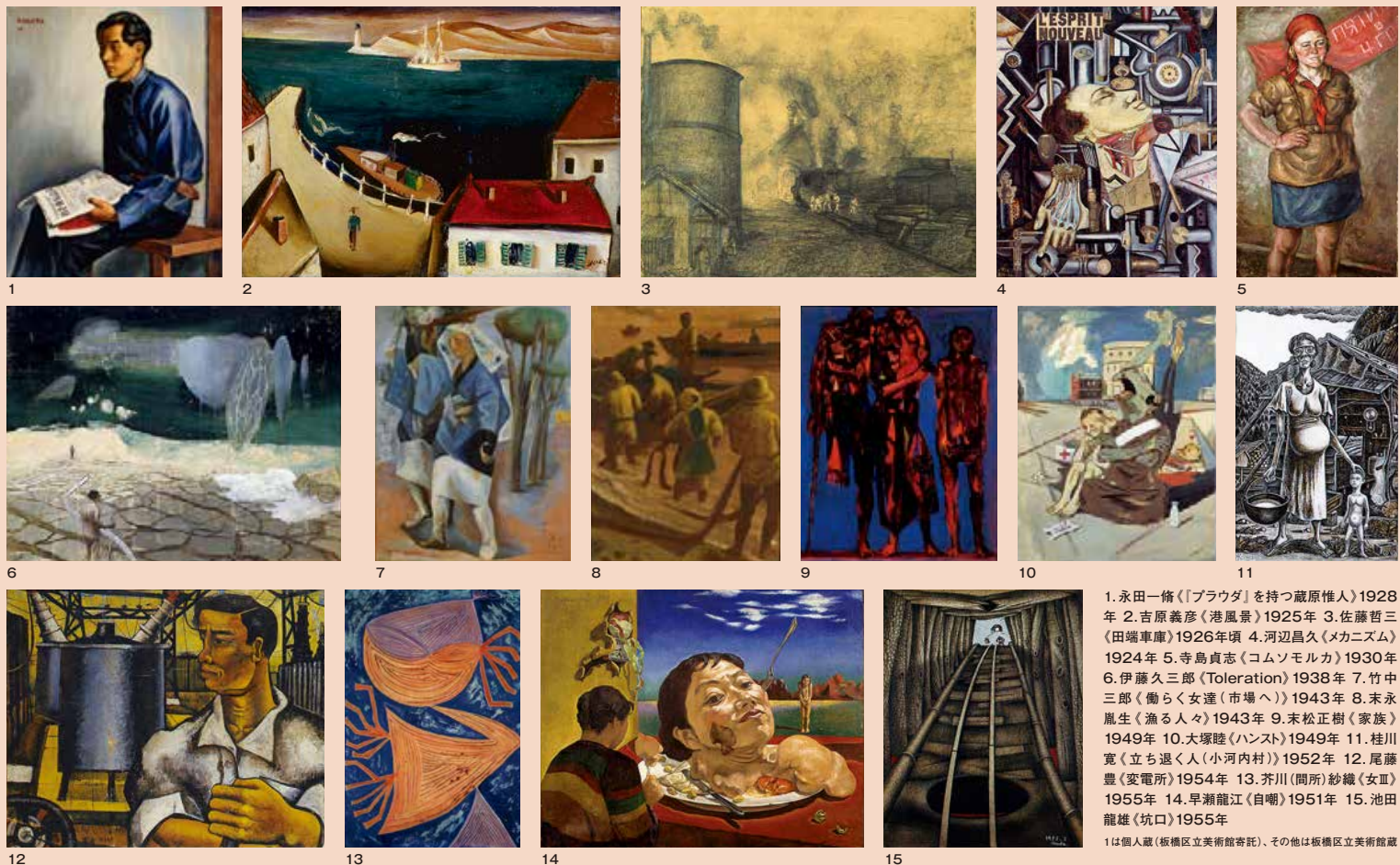
1. 永田一修「[ブラウダ]を持つ蔵原惟人」1928年 2. 吉原義彦「港風景」1925年 3. 佐藤哲三「田端車庫」1926年頃 4. 河辺昌久「メカニズム」1924年 5. 寺島貞志「コムソモルカ」1930年 6. 伊藤久三郎「Toleration」1938年 7. 竹中三郎「働らく女達(市場へ)」1943年 8. 末永胤生「漁る人々」1943年 9. 末松正樹「家族」1949年 10. 大塚睦「ハンス」1949年 11. 桂川寛「立ち退く人(小河内村)」1952年 12. 尾藤豊「変電所」1954年 13. 芥川(問所)紗織「女」1955年 14. 早瀬龍江「自嘲」1951年 15. 池田龍雄「坑口」1955年 1は個人蔵(板橋区立美術館寄託)、その他は板橋区立美術館蔵

本展では昨年度にご寄贈いただいた、岩崎鐸、片谷隼子、末永胤生、竹中三郎、寺田政明、日笠薫、藤沢典明、古沢岩美の作品も併せてご紹介いたします。