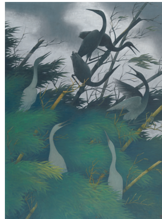
《風騒》1966年(日本芸術院)