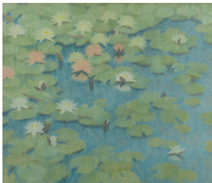
《睡蓮》1952年(福知山市佐藤太清記念美術館)