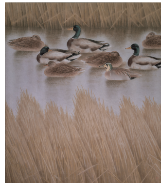
《旅鳥》1985年(常陽藝文センター)