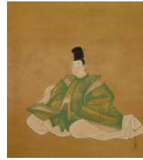
狩野周信 六歌仙図