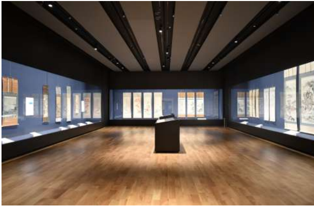
新しくなった板橋区立美術館