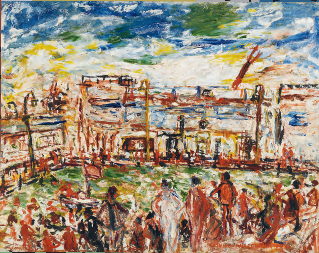
長谷川利行《水泳場》 1932年