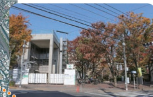
ひがし たいいくかん 東板橋体育館

りくぐんそうへいしょうこうしょう かやくせいそうしょ だい に りくぐんそうへいしょう せいそうしょ 陸軍造兵廠火工廠板橋火薬製造所(東京第二陸軍造兵廠板橋製造所)