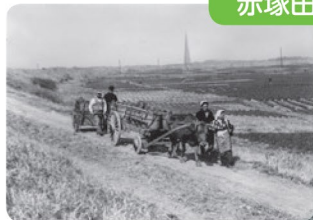
【板橋区公文書館所蔵】 昭和20年代