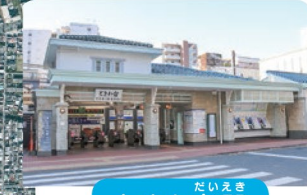
ときわだいえき ときわ台駅