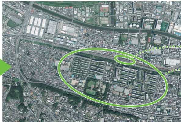
たかしまだいら ちいき れいわがんねん 令和元年(2019)撮影