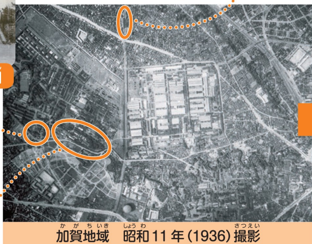
かが ちいき しょうわ 昭和11年(1936)撮影