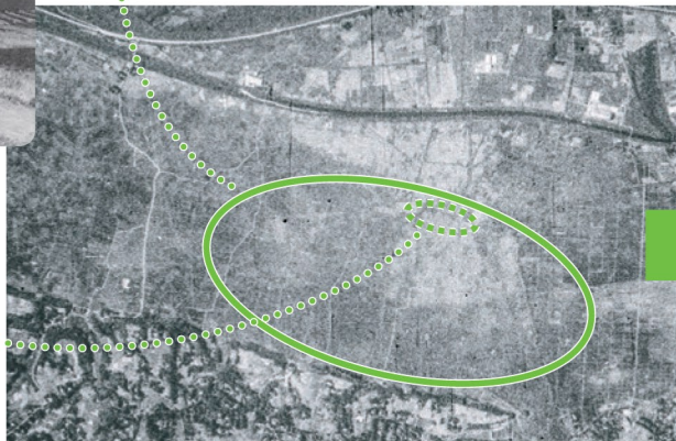
たかしまだいら ちいき しょうわ 昭和11年(1936)撮影