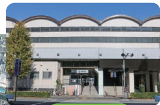
たかしまだいらえき 高島平駅