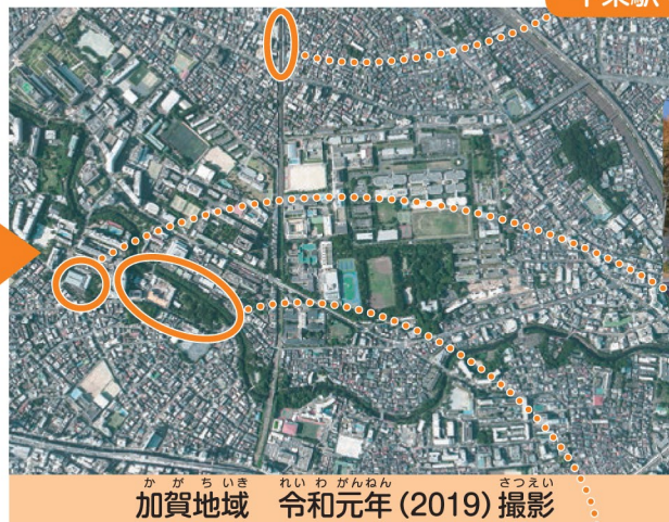
かが ちいき れいわがんねん 令和元年(2019)撮影