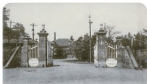
かやくせいそうしょもん 板橋火薬製造所の門