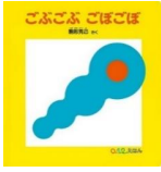
「ごぶごぶ ごぼごぼ」 駒形 克己/作 福音館書店