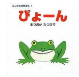
「びょーん」 まつおか たつひで/作・絵 ポプラ社