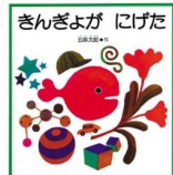
「きんぎょが にげた」 五味 太郎/作 福音館書店