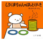
「しろくまちゃんのほっとけき」 わかやまけん/作 もりひさし/作 わだよしおみ/作 こぐま社