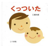
「くっついた」 三浦太郎/作 こぐま社