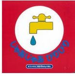
「じゃあじゃあびりびり」 まついのりこ/作・絵 借成社