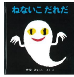
「ねないこだれだ」 せなけいこ/作・絵 福音館書店