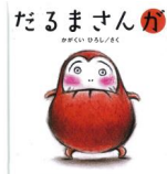
「だるまさんが」 かがくい ひろし/作 ブロンズ新社