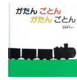
「がたん ごたん がたん ごたん」 安西 水丸/作 福音館書店