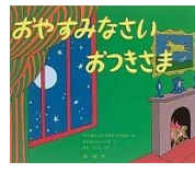
「おやすみなさい おつきさま」 マーガレット・ワイス・ブラウン/作 クレメント・ハード/絵 せたていじ/訳 評論社