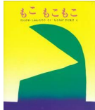
「ももももこ」 谷川俊太郎/作 元永定正/絵 文研出版