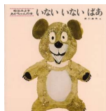
「いのないないばあ」 松谷 みよ子/ぶん 瀬川 康男/え 童心社