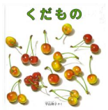
「くだもの」 平山 和子/作 福音館書店