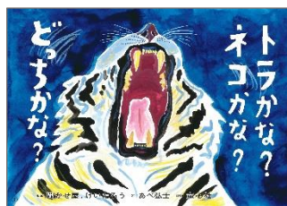
▲『トラかな？ ネコかな？ どっちかな？』（童心社） 聞かせ屋。けいたろう／脚本、あべ弘士／絵