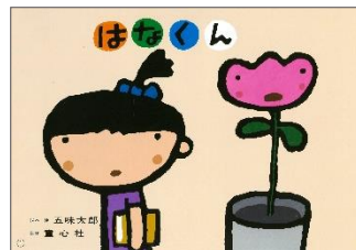
▲『はなくん』（童心社） 五味太郎 脚本／絵